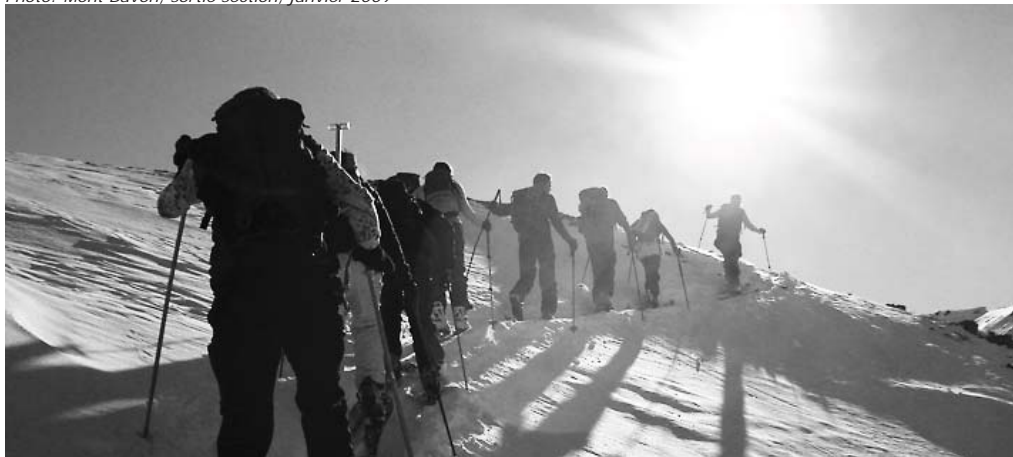
Photo: Mont Bavon, sortie section, janvier 2009