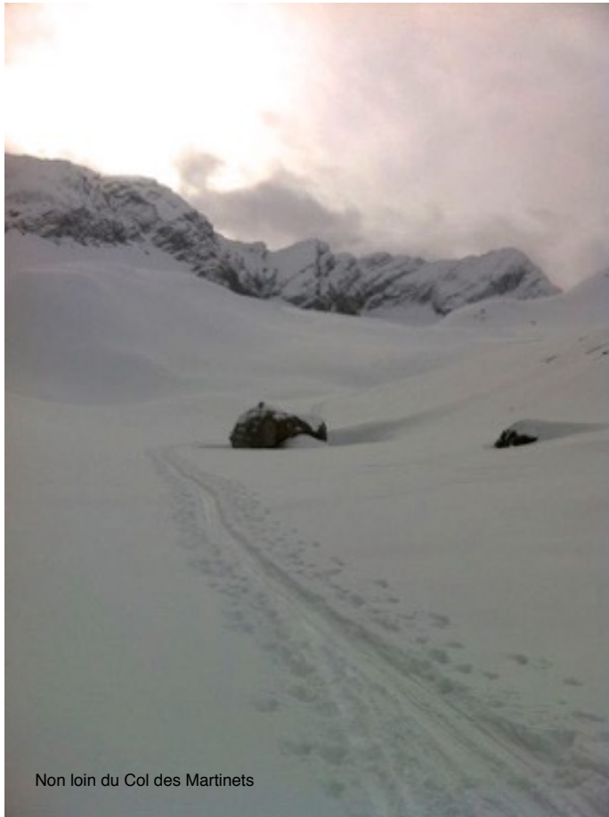
Non loin du Col des Martinets