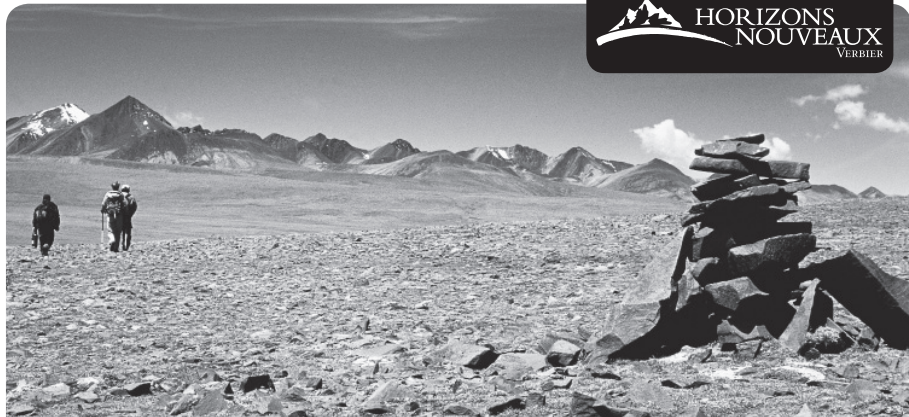
Tibet, au sud du Yamdrok Tso