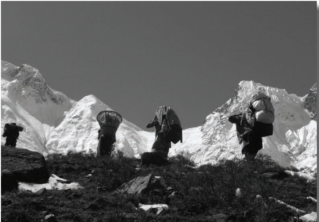
Photo: La montée au camp de base de l'Annapurna, Olivier et Madeleine Pasche